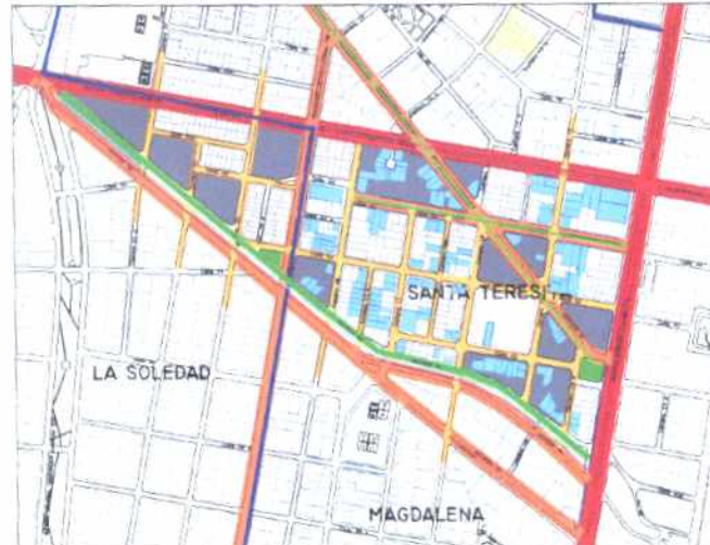
Inmuebles de Interés Cultural - MORFOLOGÍA EN PLANTA