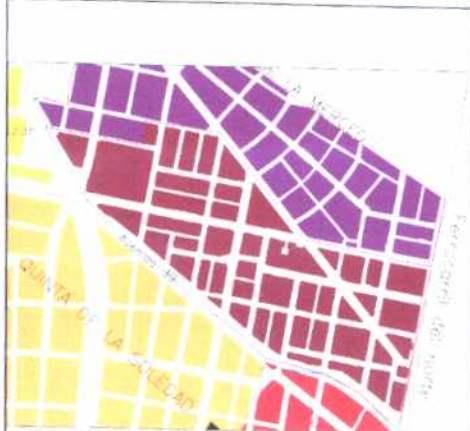
PLANO DE URBANIZACIONES

El barrio limita al norte con la calle 45, al occidente termina en una punta, al sur con la avenida 39 y el río Arzobispo y al norte con la avenida Caracas. Sus vías limítrofes y dos más internas se presentan como avenidas, lo cual es curioso para un barrio de tan pequeñas proporciones.