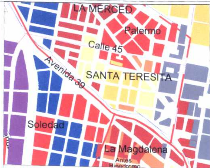
CRECIMIENTO HISTÓRICO - CRONOLOGÍA